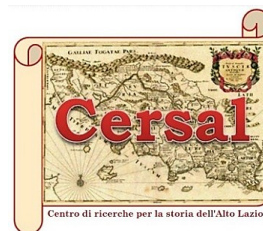
Centro di ricerche per la storia dell'Alto Lazio